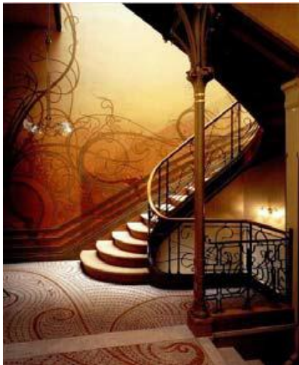
2A. Víctor Horta. Casa Tassel . 1892.