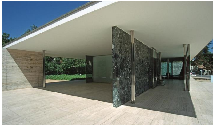
2B. Mies van der Rohe: Pabellón de Alemania en la Expo de Barcelona. 1929.