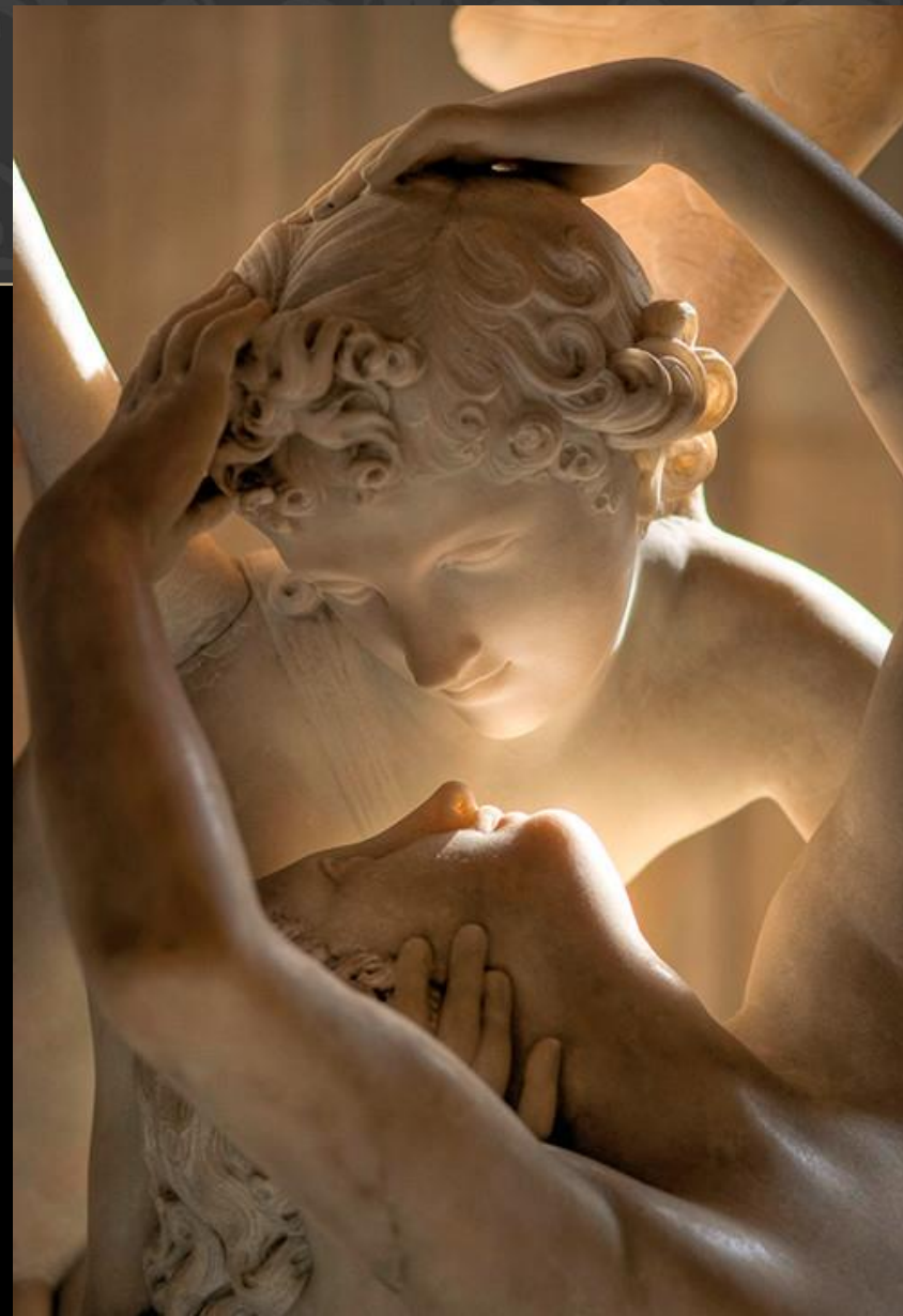
“Psique reanimada por el beso del amor” Antonio Canova - 1793

Le suplicó a Zeus y a Afrodita su permiso para casarse con Psique. Estos accedieron y Zeus la hizo inmortal. Como fruto de su unión tuvieron una hija llamada Hedoné.