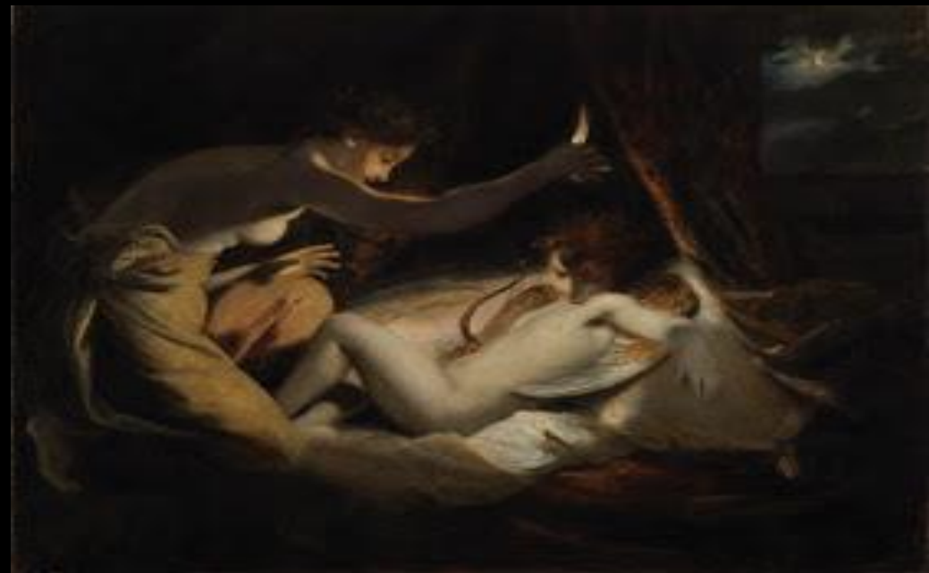
“Eros y Psique” Joshua Reynolds - 1789

Como cuarto trabajo, tenía que pedir a Perséfone un poco de su belleza que Psique guardaría en una caja negra que Afrodita le dio, ya que la hermosura del inframundo es mortal al tacto humano.