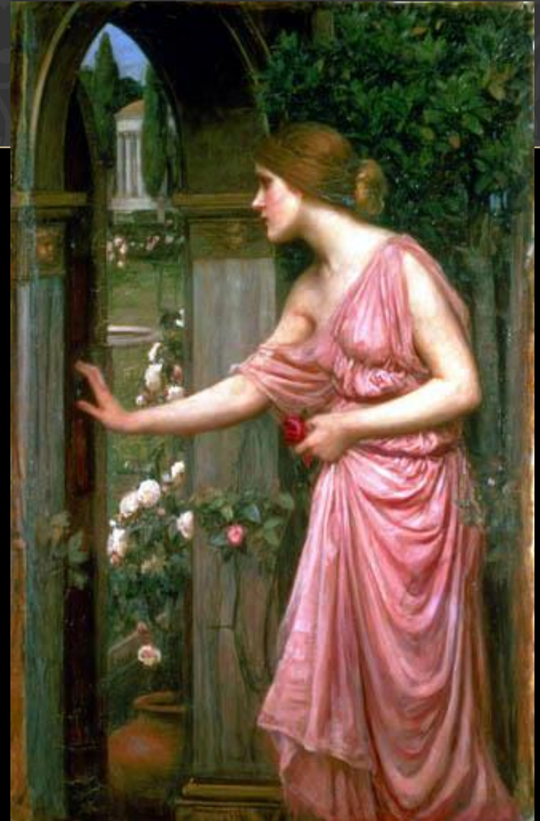
"Psique abre la puerta del jardín de Cupido" John William Waterhouse , 1903.

Mientras sus dos hermanas ya se habían casado, a Psique nadie la quería por esposa, ya que su belleza sobrehumana asustaba a los pretendientes.