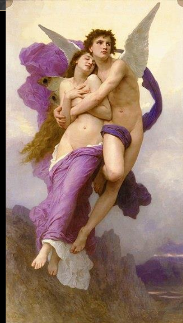
“El rapto de Psique” William-Adolphe Bouguereau - 1895

Le prohibió a Psique toda indagación sobre su identidad, pero un día fue a ver a sus hermanas y estas la envidiaron, por lo que la convencieron para que en mitad de la noche encendiera una lámpara y observara a su amado, asegurándose de que sólo un monstruo querría ocultar su verdadera apariencia.