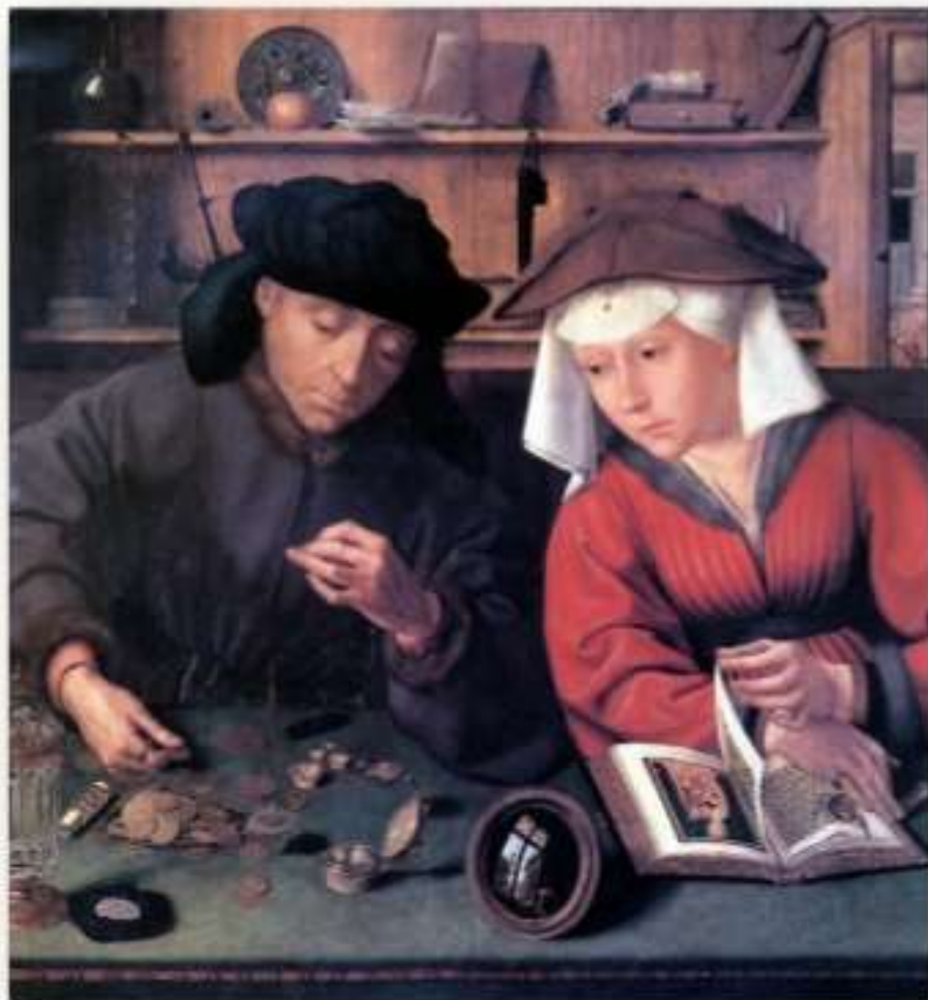
El prestamista y su esposa. 1515 Quentin Massys

La buena situación económica propicia el optimismo ante la vida y nos aleja del pesimismo y el temor a la muerte que caracteriza a la Edad Media. Esto se reflejará en el arte. Además la mayor riqueza permite financiar más obras artísticas.