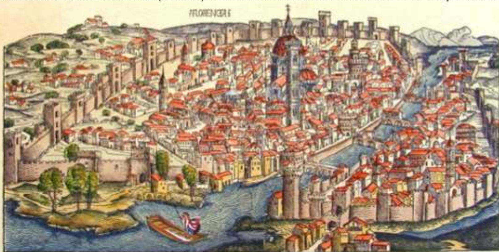
Veduta di Firenze, stampata a Norimberga nel 1611.

Surge en Italia en el siglo XV a partir de las esculturas de Nicolás Pisano , que copia sarcófagos romanos e inicia la escultura moderna (en Pisa). Tras su muerte el centro cultural pasa a Florencia, ciudad en la que se rompe con el gótico. En arquitectura lo hace Brunelleschi , en pintura se evoluciona a partir de las innovaciones del trecento ( Giotto ). Por último afectará también a la arquitectura.