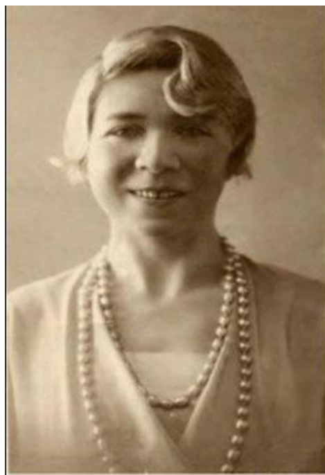
Alfonsina Storni 1892- 1938

“SE ME VA DE LOS DEDOS LA CARICIA SIN CAUSA, SE ME VA DE LOS DEDOS... EN EL VIENTO, AL PASAR, LA CARICIA QUE VAGA SIN DESTINO NI OBJETO, LA CARICIA PERDIDA ¿QUIÉN LA RECOGERÁ?” ALFONSINA STORNI