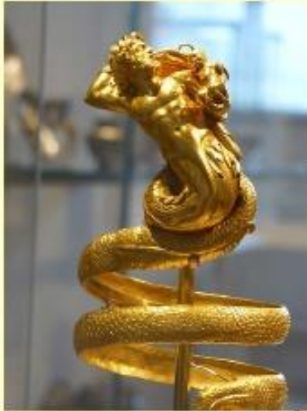
Brazaletes 200 a C