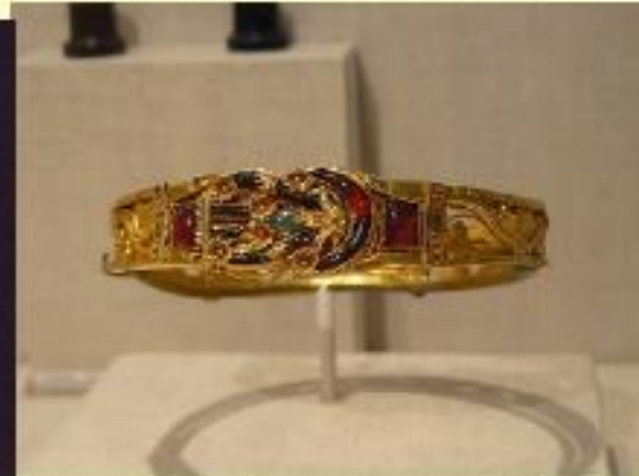
Brazaletes 300-200 a C

Piedras preciosas y Perlas (desde A. Magno)