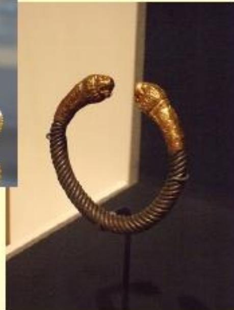
Brazaletes s IV a C

Piedras preciosas y Perlas (desde A. Magno)