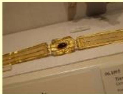
Diadema s III-II a C