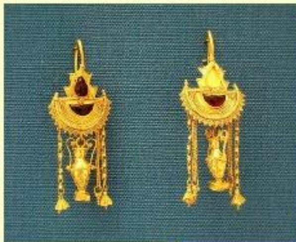
Pendientes Siglo II-I a C