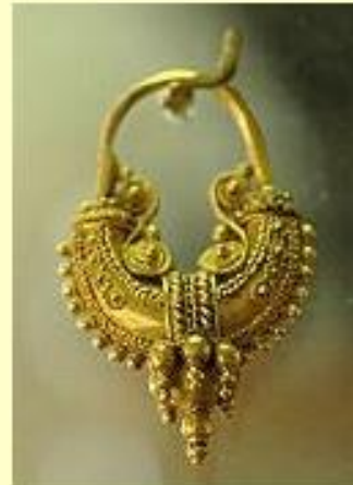
Pendiente de barco