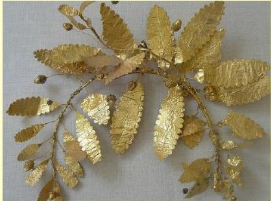
Guirnalda de hojas de roble de carácter funerario