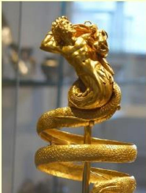
Brazalete 200 a C