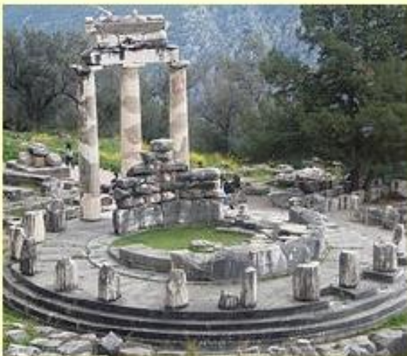
Tholos de Delfos