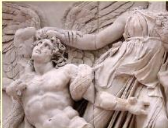
Relieves del Altar del Pérgamo