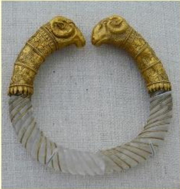
Brazalete tipo persa