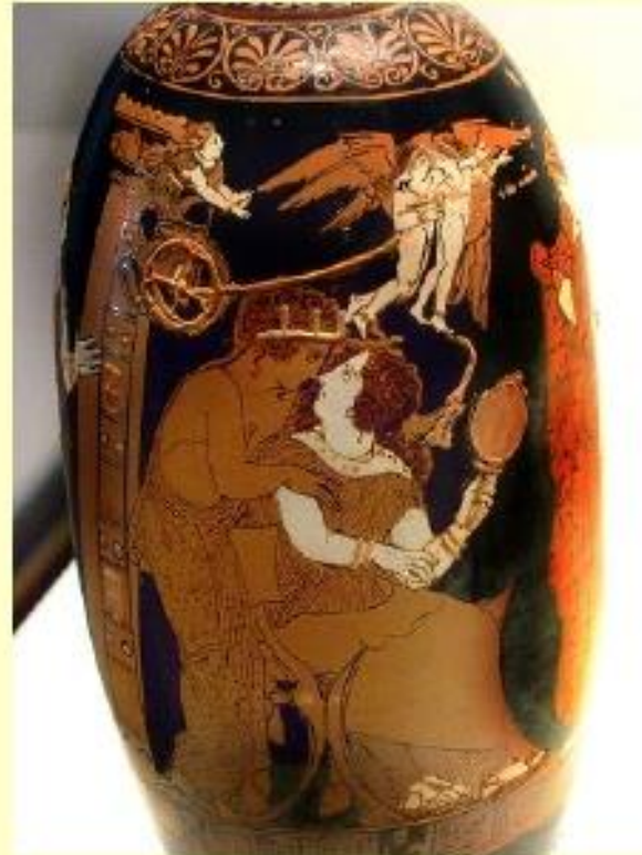
Lekitos siglo V a C

Armonía, simetría, sobriedad en las formas