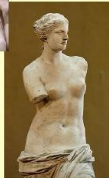
Venus de Milo