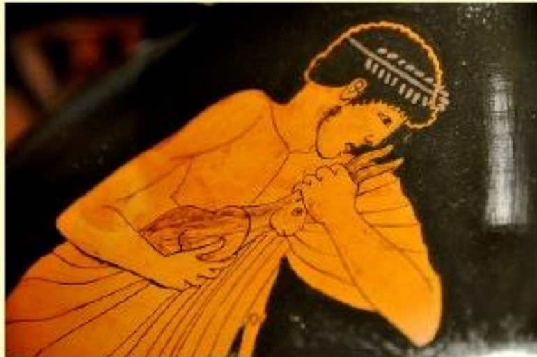
Detalle cerámica griega

Frente a la mujer, el hombre lleva menos joyas: