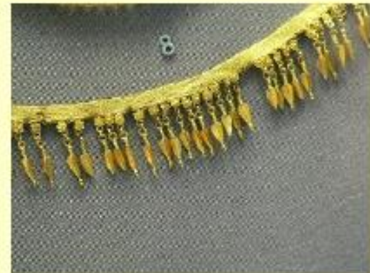
Collar de malla