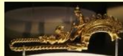
Fíbula s. III a C