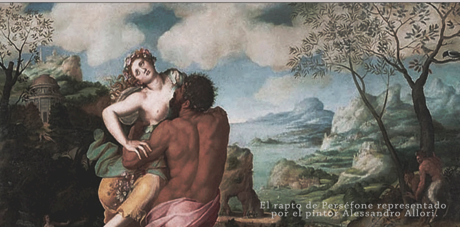
El rapto de Perséfone representado por el pintor Alessandro Allori.

Se dice que las estaciones vienen de este mito. La primavera termina cuando Perséfone está en el infierno junto a Hades y por parte de su madre, al entristecerse también, la tierra se vuelve estéril y llega el Invierno.