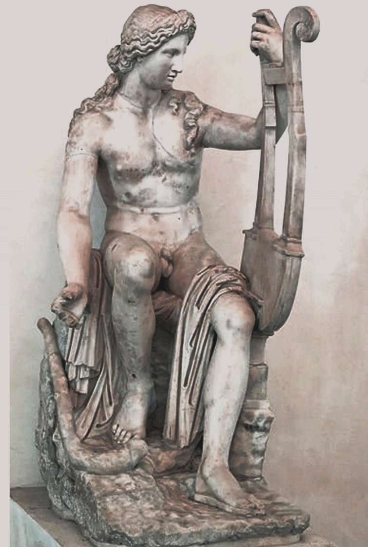
Apolo Citarreo (Palacio Altemps)