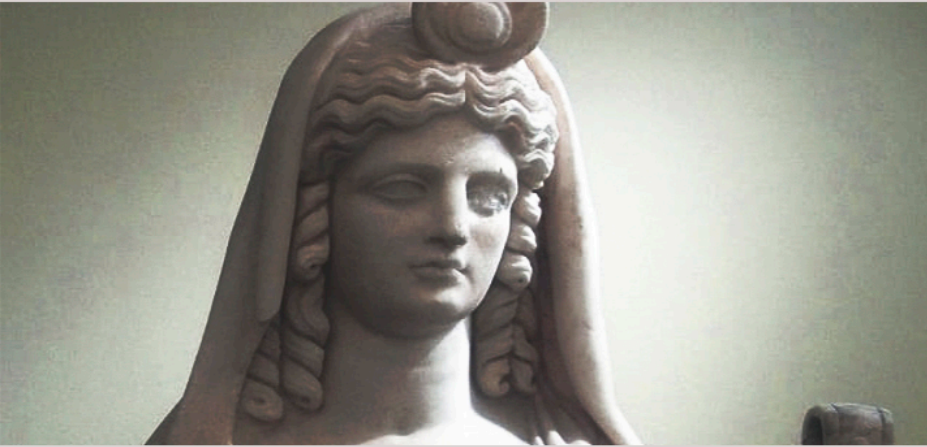
Estatua hallada en el templo de los dioses egipcios de Gortina.