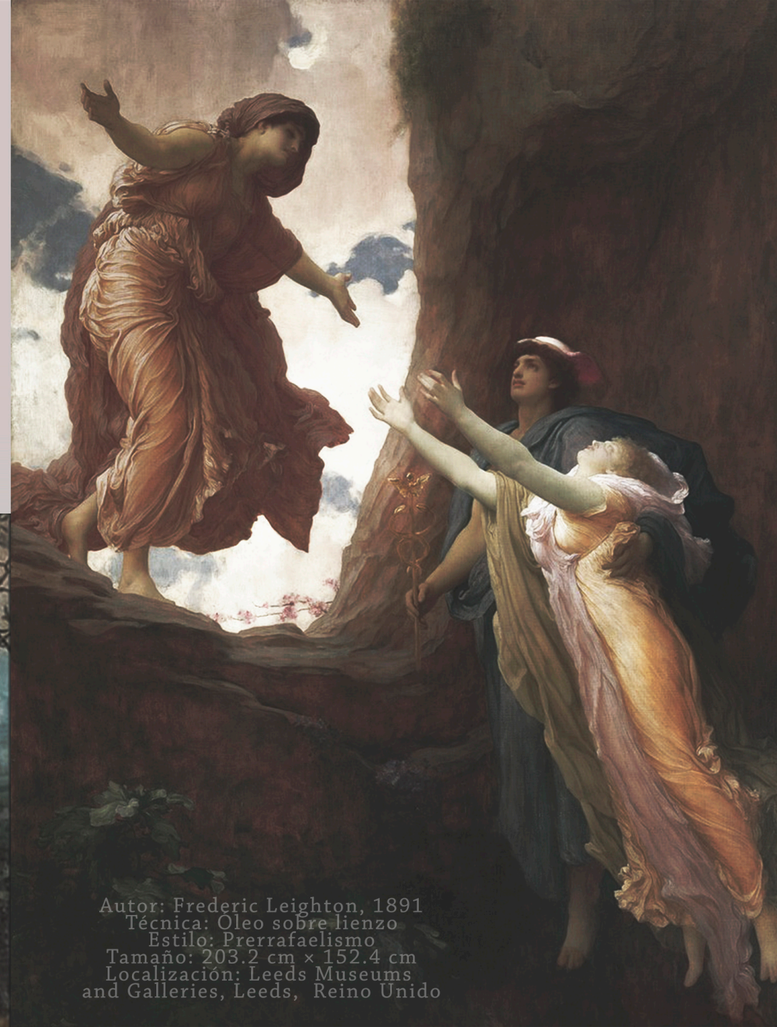
Autor: Frederic Leighton, 1891 Técnica: Oleo sobre lienzo Estilo: Prerrafaelismo Tamaño: 203.2 cm x 152.4 cm Localización: Leeds Museums and Galleries, Leeds, Reino Unido