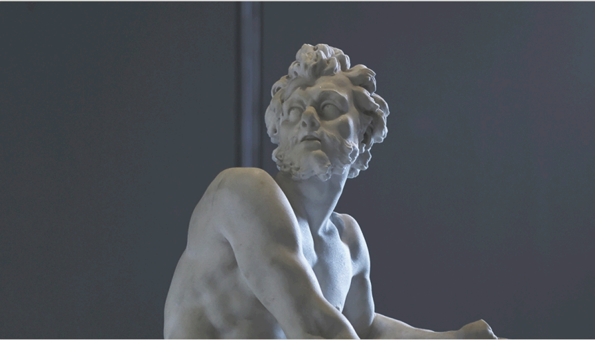
Hefesto en la forja por Guillaume Costou (Louvre)