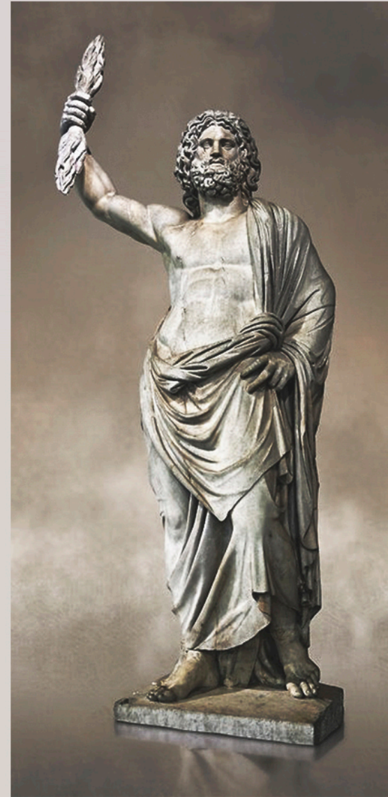
Zeus de Esmirna, desenterrado en el 1680.